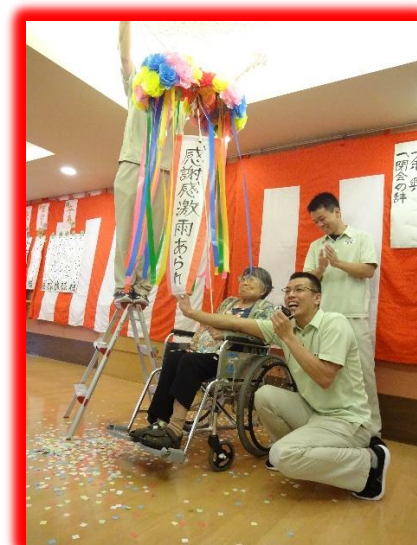
敬老祝賀会の一場面。