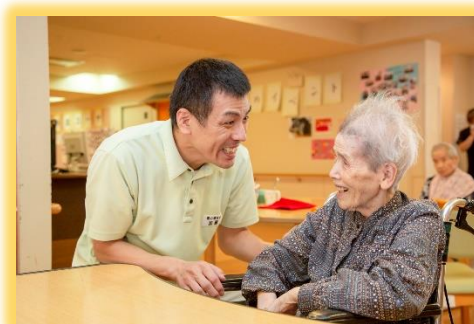
暖かくお迎えいたします。