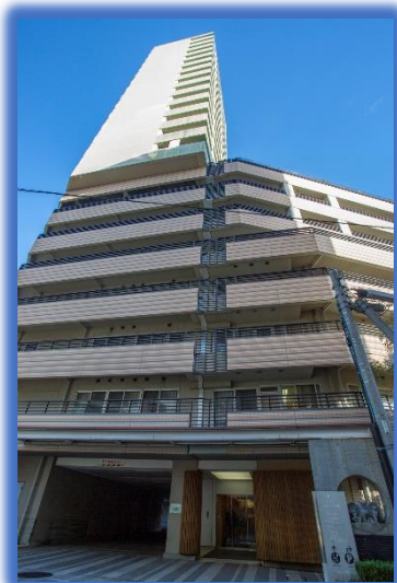
池袋駅から徒歩圏内！