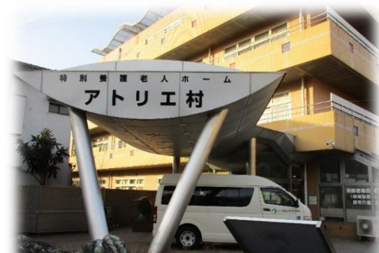
アトリエ村正面玄関

ボランティアの皆様日々助けられ、支えられ、皆様との触れ合いを大切にしています。施設内での活動再開後は、ご利用者とのお話し相手や食事の後片付け、歌や楽器の演奏、行事のお手伝い、その他お一人おひとりに合ったプログラムをご用意します。あなたにぴったりの活動がきっと見つかるはずです。是非ご連絡ください。いつでもお待ちしております。