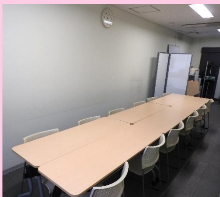
▲15名ほどが入れる広さです