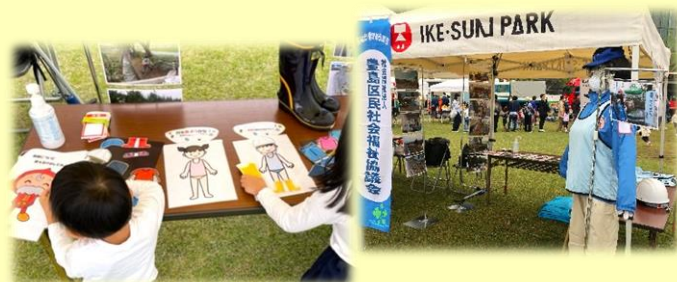
2022年開催時の様子 ※2023年は雨天中止