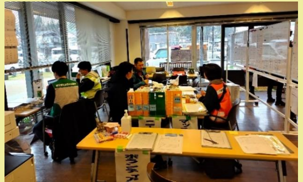
▲穴水町災害ボランティアセンター

当時は家屋の解体は進んでおらず、家屋倒壊があらこちらで見られ、応急危険度判定で赤紙(危険)判定の家が多くみられました。「災害ごみの運搬を手伝ってほしい」が多数でしたが、「ピアノが倒れて、壊れたので災害ごみとして出したい」、「ブロックの倒壊があり、手伝っていただけないか」等々、多様なニーズがありました。