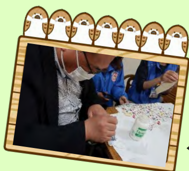
←慣れない手つきでデコパージュに挑戦する職員

お伺いした日は、不織布マスクにワンポイントを付けるデコパージュマスク作りをされていました。街中で知らない人から「どこで買えますか?」「売ってもらえませんか?」と声を掛けられることもあるそうです。他の地域活動の仲間にも好評で、たくさん作ってもすぐになくなってしまいます。