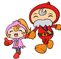
豊島区民社協キャラクター ふくみん ふくじい