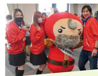
抽選コーナーの協力助っ人! (マルハン池袋店)