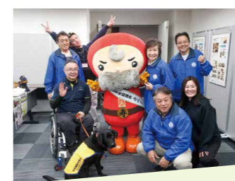
補助犬と人との優しい交流。 (東京巣鴨ライオンズクラブ)