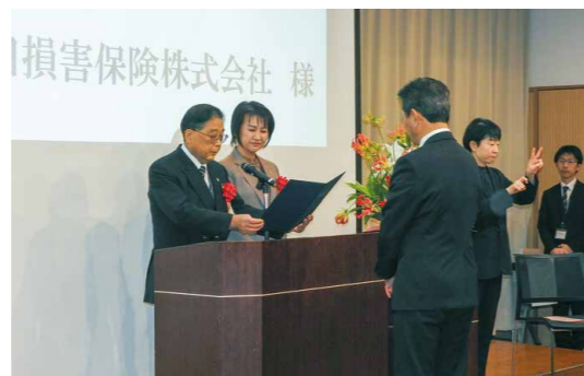
明治安田損害保険 株式会社様