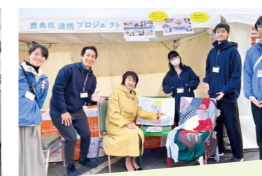
ベンチプロジェクト新展開! (飛鳥未来・飛鳥未来きずな高校)