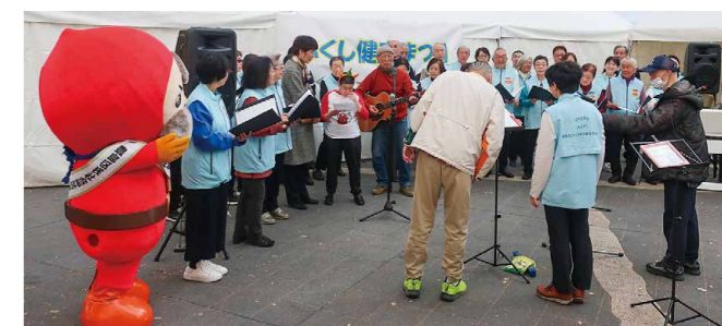
▼いけぶくろの里・目白福祉作業所からのゲストを迎えての大合唱 (混声合唱団みみずく)