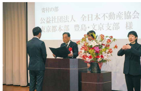
公益社団法人 全日本不動産協会東京都本部 豊島・文京支部様