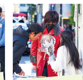
まちがい探し。全部わかるかな? (LBS@MUSIC)