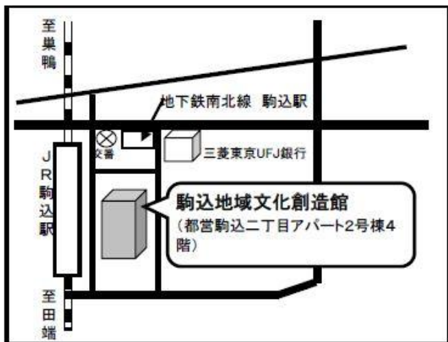
駒込地域文化創造館 (駒込 2-2-2)