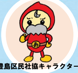
豊島区民社協キャラクター ふくじい