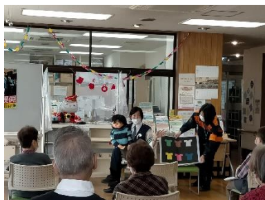
お膝の上で大ちゃん(5才)も一緒に勉強しました。

してから、電話をとることで、特殊詐欺(一時はオレオレ詐欺と呼ばれていました)を防ぎやすくなること。なので、難しいですが、電話にすぐにでないことが一番の防御策ですと案内していました。