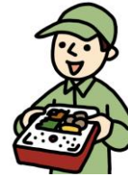
生活支援サービス