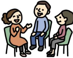
地域のつどいの場 (サロン・大人食堂・高齢者クラブなど)