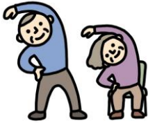
健康体操・としまる体操