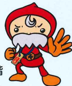
豊島区民社協キャラクター ふくじい

豊島区民社会福祉協議会ホームページ http://toshima-shakyo.or.jp