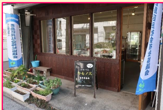
▲巣鴨サロン「カモノス」