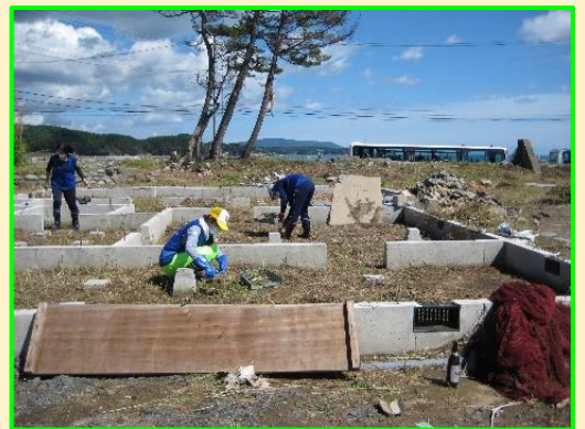
▲陸前高田市でのボランティア活動(家の掃除)

当時の記憶は未だ鮮明だ——地域の人たちの温かさ、熱い想い、哀しみの深さ。人によっては復興はまだ終わらないかもしれない。いつかまた訪れて東松島の綺麗な海を見たい。災害はいつ起こるか分からない。首都直下型地震は「炎の津波」が押し寄せてくるだろう。自助・共助等、日頃より「防災隣組」の仕組みを作っていきたい。