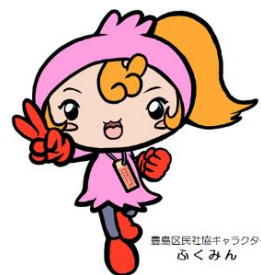
豊島区民社会福祉協議会キャラクター ふくみん