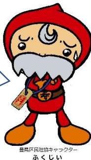
豊島区民社会福祉協議会キャラクター ふくじい