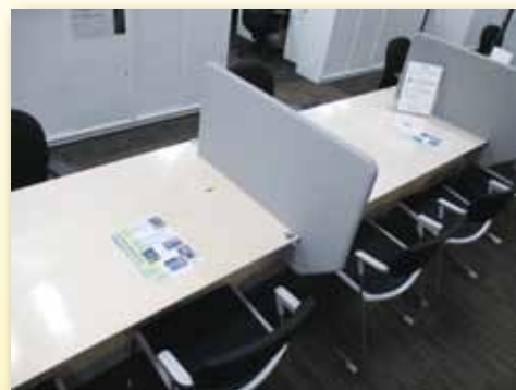
ワークステップとしま