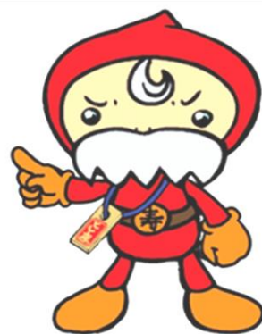
豊島区民協キャラクター ふくじい

対象：関心のある方ならどなたでも 定員：70名程度（要申込、先着順） 申込：電話またはFAXにて