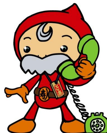
豊島区民社協キャラクター ふくじい