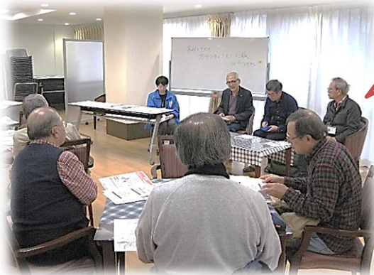
↑先輩ボランティアさんのお話し