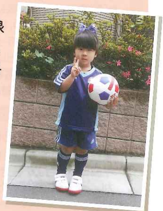
いつもヤンチャで、女の子なのにサッカーや電車が大好きです!

震災時、生後1ヶ月だった娘も3歳になりました。今でも、ボロボロになった高速道路を走って都内に来た時を思い出します。色々我慢させて不自由な思いもさせて来たと思いますが、色々な人と