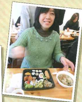
豚汁おかわりした? 私は2杯したのよ