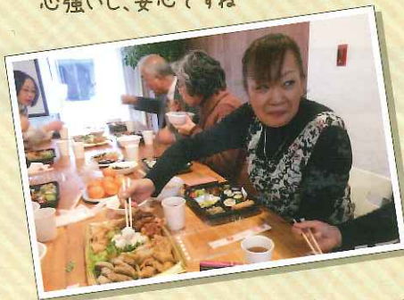
避難生活はまだまだ続くけれど、 みんなであらゆる楽しんでほしい