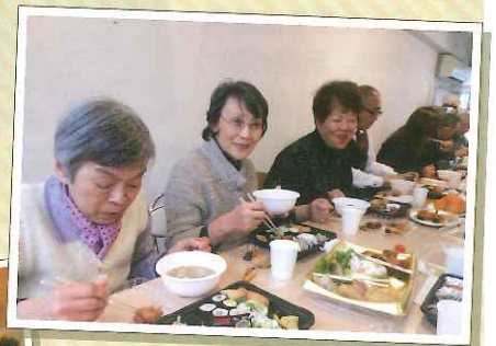
今年は新しい出会いを 探したいな