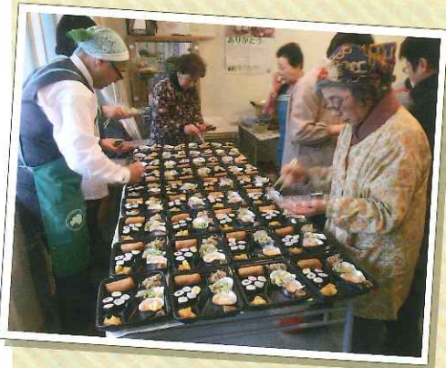
サロンがあるから 心強いし、安心ですね

東京に避難して3度目のお正月を迎え、サロンでは初めての合同新年会を行いました。参加されたみなさんが仲良く一緒になってお弁当や豚汁を準備。全員でテーブルを囲み、笑ったり涙したり、穏やかなひとときをわきあいあいと過ごしました。未だ不安は山積みですが、今年も楽しく元気な日々を送りたい、そんな思いの年始の一日となりました。