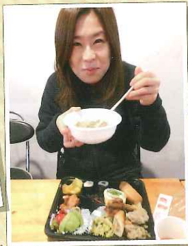
いつもお世話になって、 本当にありがとうございます