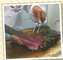
初めて参加しました。 こんなに美味しいお料理が 食べられるなんて。。。