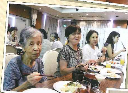
なかなか 会わない人と 交流ができたし、 氷の彫刻もあって 楽しかった。