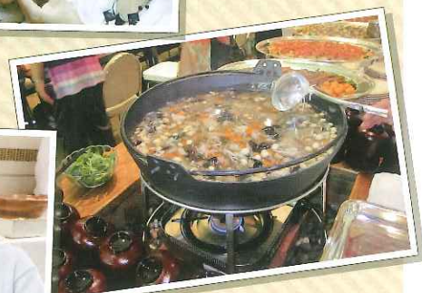
郷土料理も出て、 古里を思い出しました。